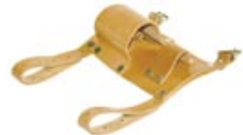
Fensterwischertasche aus Leder für die Leiter