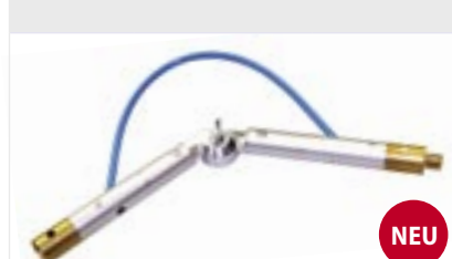
Alu - Gelenk für Wasserteleskopstangen