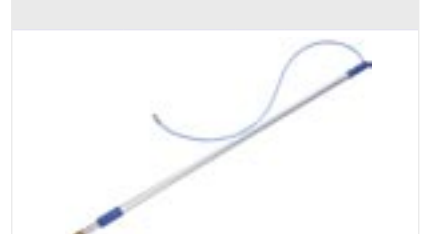
Wasser-Teleskopstange mit Wasserschlauchanschluss und R¼ Gewinde für Waschbürsten