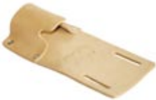
Fensterwischertasche aus Leder