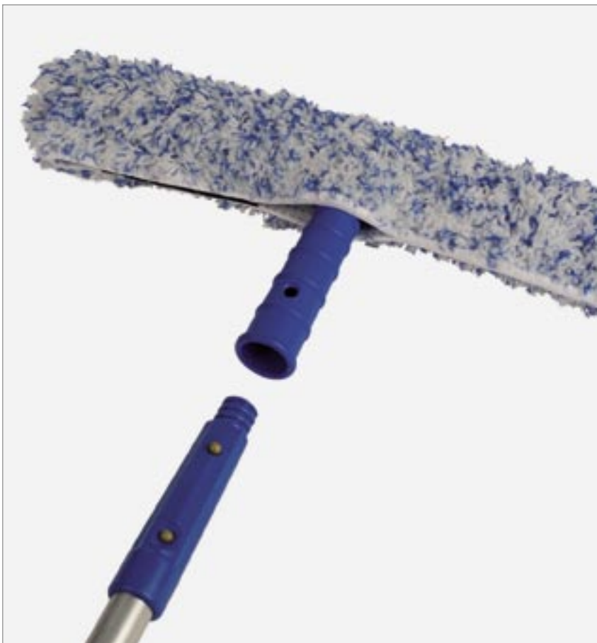
Langer Griff, ergonomisches Arbeiten