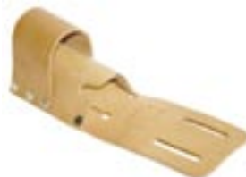
Doppelwischertasche aus Leder