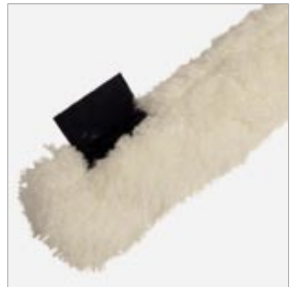
Klettverschluss oder Druckknöpfe