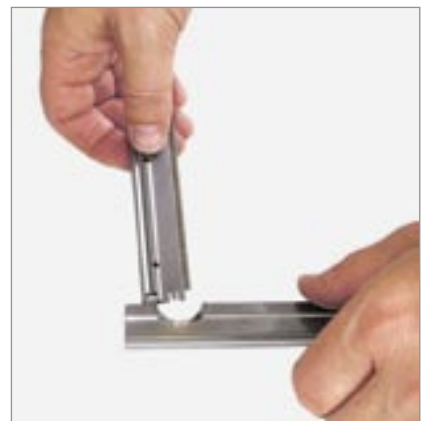
Mit der Einkerbung am Ende können die Glashobelklingen herausgelöst werden

Der Fenster- und Bodenschaber hervorragend einsetzbar gegen Aufkleber, Farbreste etc.