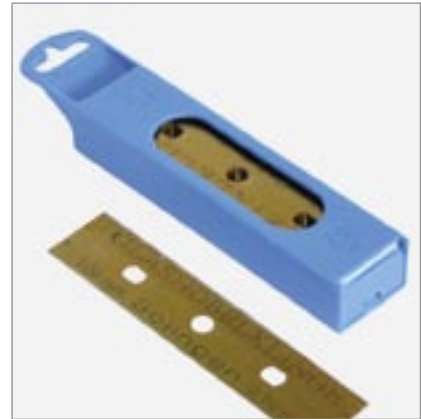
Sicherheits-Dispenser passend für 25 Klingen

Der Comet-Schaber „rot“ oder „grün“ ist sehr stabil gebaut und mit einer Hand zu bedienen. Die Klinge ist versenkbar und aufsteckbar auf die LEWI-Teleskopstange.