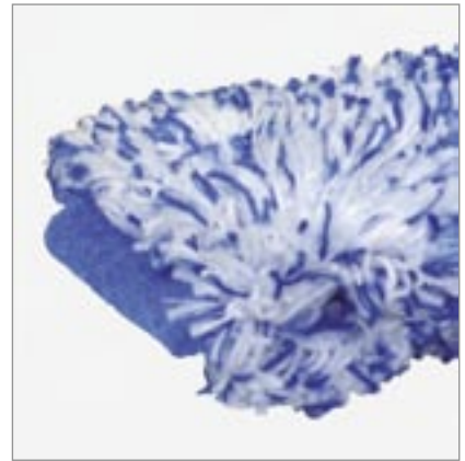
Doppelte Verriegelung am Ende

Der „NOMIC“ Kunststoff T-Träger mit ergonomischem Griff wird aus formstabilem Kunststoff und mit extra Wasserkammern hergestellt.