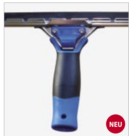
Die neue Feder greift sicher in die V-Kante.